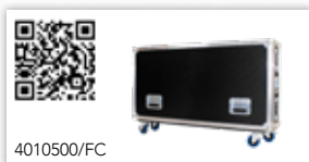
Flight-case à roulette