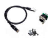
Kit adaptateur RJ45/etherCON