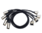
Kit adaptateur 4 DMX