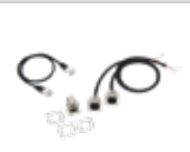
Câbles DMX vers XLR5 + 1 x RJ45