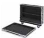
Flight-case à roulette