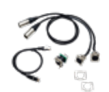
Kit complet adaptateur RJ45 + DMX