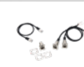
Câbles DMX vers RJ45 + 1 x RJ45